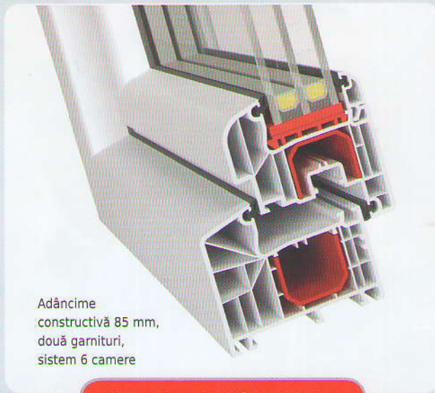
Adâncime constructivă 85 mm, două garnituri, sistem 6 camere